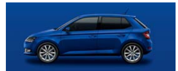
ENERGY BLUE UNI