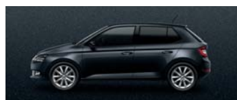
CRYSTAL BLACK METALLIC