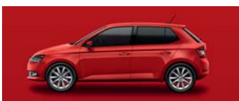
CORRIDA RED UNI