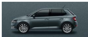
QUARTZ GREY METALLIC