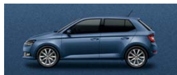
TITAN BLUE METALLIC