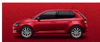
VELVET RED METALLIC