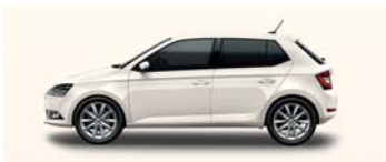
CANDY WHITE UNI