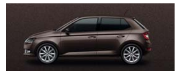
MAPLE BROWN METALLIC